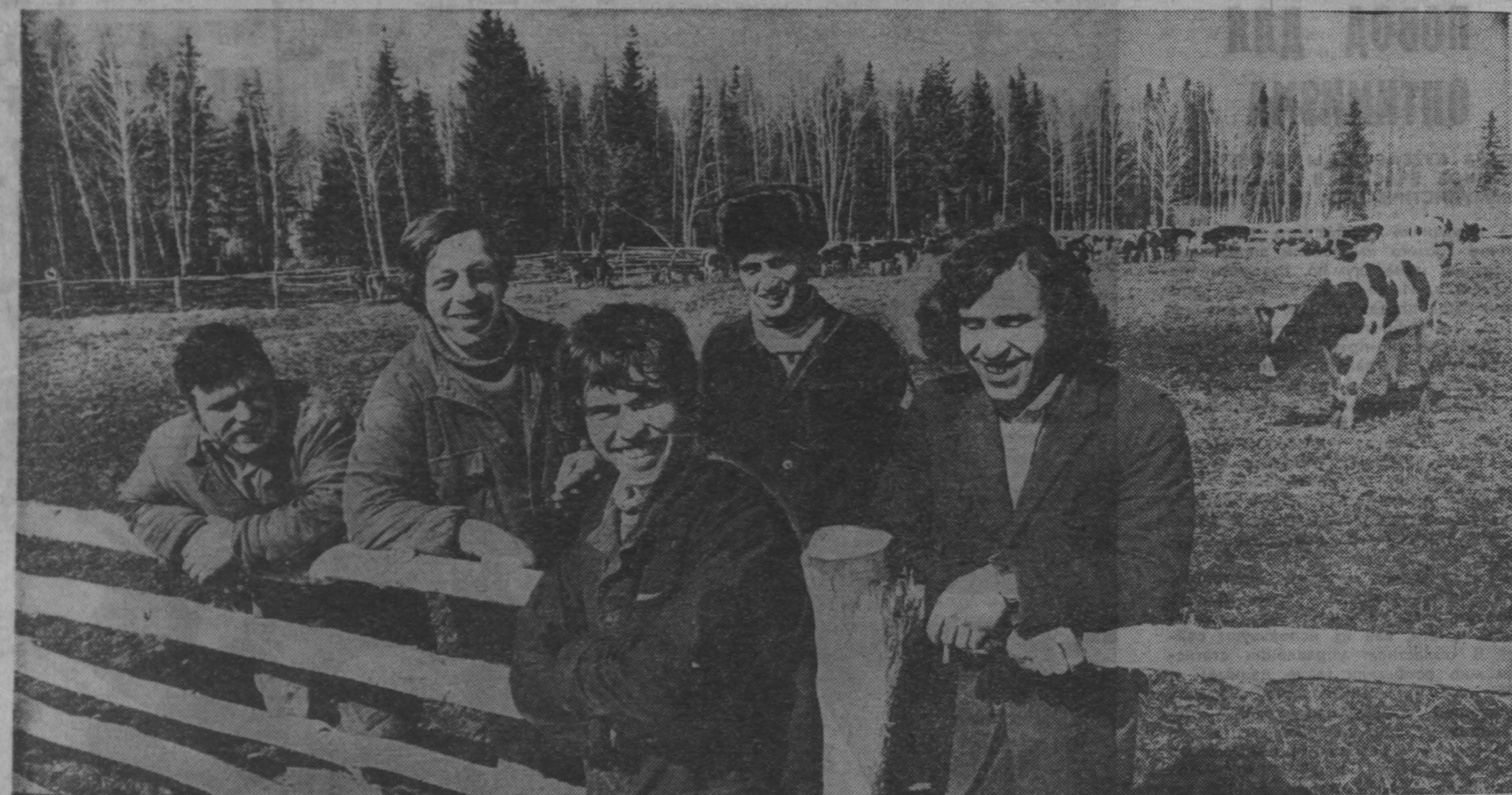
сами себе хозяева

Обсудив итоги беседы М. С. Горбачева с Генеральным секретарем ЦК Коммунистической партии Чехословакии М. Яншем, Политбюро с удовлетворением констатировало плодотворность состоявшегося обмена мнениями и сопоставления точек зрения по вопросам назревших глубоких преобразований социалистического общества. Была выявлена большая заинтересованность обеих партий в совершенствовании всего комплекса советско-чехословацких отношений, подчеркнута важность прямого сотрудничества хозяйственных организаций СССР и ЧССР, выработки новых эффективных подходов и углубленно производственной кооперации, совместного решения ряда проблем, связанных с конверсией военного производства в двух странах. По этим и другим вопросам, затронутым в ходе беседы, даны конкретные поручения.