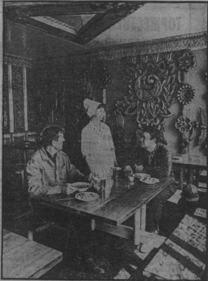
Фото В. Грызышкин. г. Новокузнецк.

фабрики повар А. Д. Нагибина и работники агро-известкового производства В. Ф. Сидяков и С. В. Траксет; в магазине заводского пищеотдела всегда можно сделать заказ на продукты питания; в цехе ректификации бензола есть своя баня. После смены приятно попариться, выпить стакан душистого чая, быстро высушить волосы; также, со вкусом изготовленные уметьцами и художниками деревянные украшения можно встретить в буфетах, столовых, магазинах, саунах.