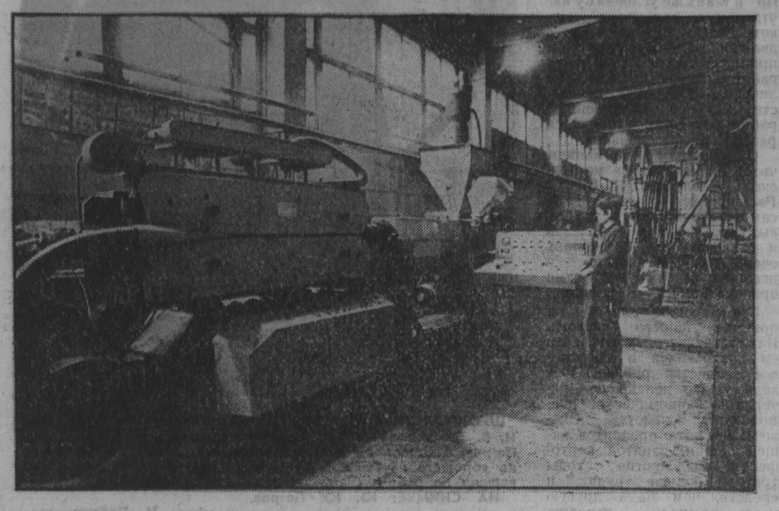
Успешно отработал в первом квартале текущего года коллектив опытно-технологического завода «Полмет» Кемеровской области. Его продукция из полимерных материалов пользуется широким спросом у работников сельского хозяйства, на угольных предприятиях, в строительных организациях. Ежегодно осваиваются новые виды продукции. Так, например, полгода назад работниками предприятия освоены выпуск многооборотных ленточных для плодородных почв области. Сегодня в области выпускается более 50 тысяч штук. Кроме того, закуплены тысячи метров полимерных труб и полиэтиленовой пленки шахтами и тепличными хозяйствами. Завод набирает темпы, расширяет свое производство. С начала года небольшой коллектив выпустил различных изделий 264 тонны. Дополнительно реализовано производство на 125 тысяч рублей. НА СНИМКАХ: машинист экскаватора Елена Михайловна, рабочий участка Людмила Николаевна Стаценко; здесь идет выпуск полимерных труб. Фото В. Грызвина, Г. Кемерово.