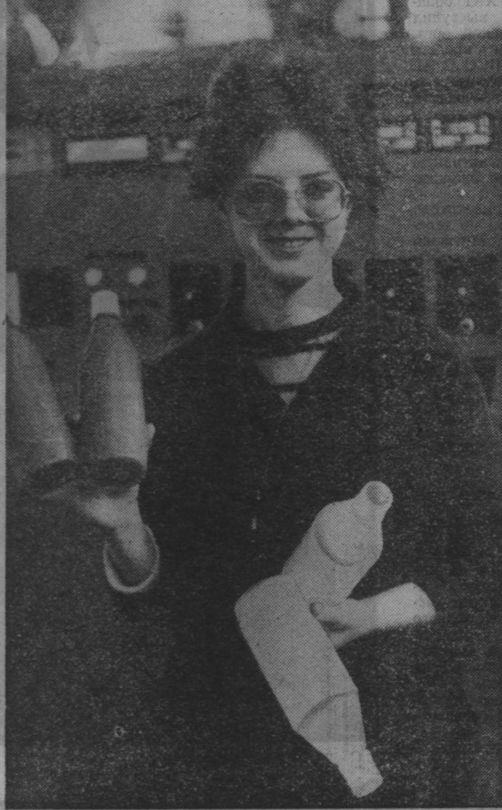
«Белизна» уже давно и заслуженно пользуется спросом у хозяек. Но она в магазинах города не заливается, ее речупают мгновенно. И еще одно неудобство: сразу много не приобрести, поскольку продается «Белизна» в тяжелых стальных бутылках. Об этом все время задумались в НПО «Азот». Порядком надоело неудобные стальные бутылки, так тормозящие выпуск продукции, ведь часто «Белизну» не во что разливать. Сейчас в объединении закончились полистироловые флаконы емкостью 0,5 л и уже начали выдавать продукцию. В 1989 г. удобные, легкие полистироловые флаконы будут частично компенсировать недостающую стальной тара. А с освоением импортного оборудования потребность в полистироловых флаконах будет удовлетворена. На СМИКЕ «Спору на прилавках наших магазинов появится так необходимый всем хозяйкам «Белизна» вот в таких удобных, изящных флаконах», — говорит мастер смены участка полимерной тары Ольга Кузнецова. Е. ФИЛОНОВА.

Хотел спросить руководителя Гурьевского деревообрабатывающего завода, который выпускает табу-