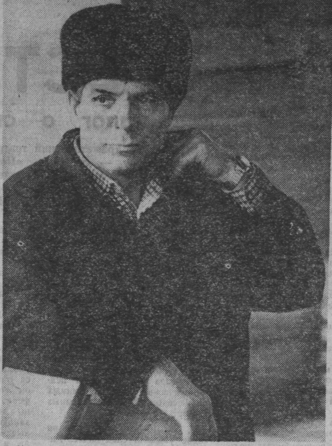
фото Ветеран труда