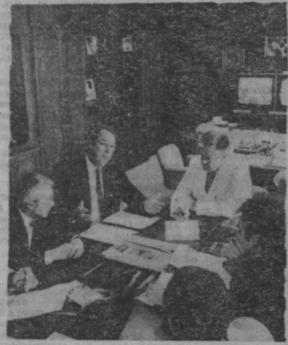
Задачи, поставленные перед здравоохранением... Задачи, поставленные перед здравоохранением...