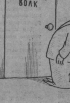
Рис. М. Ларичева.