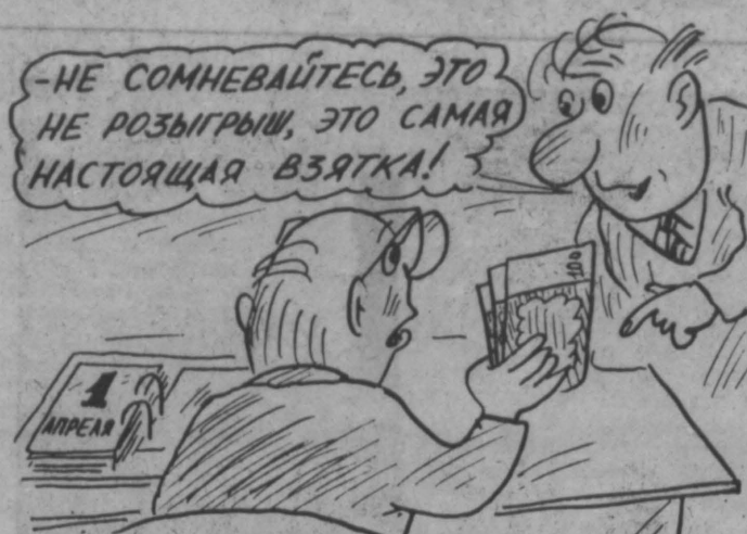
«РОЗЫГРЫШ» Рис. С. Веткина.