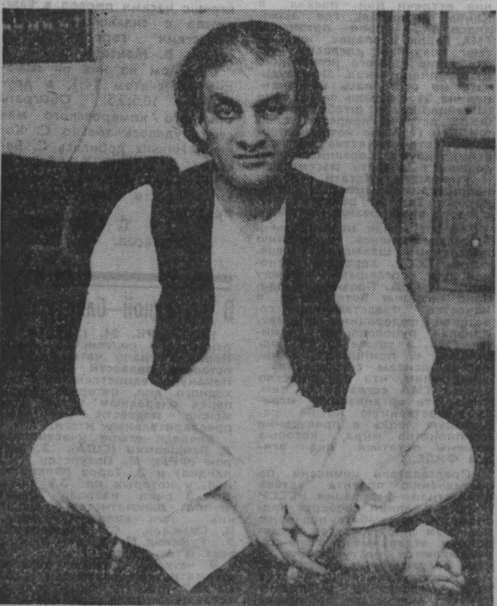
Салман Рушди, автор романа «Сатанинские стихи».