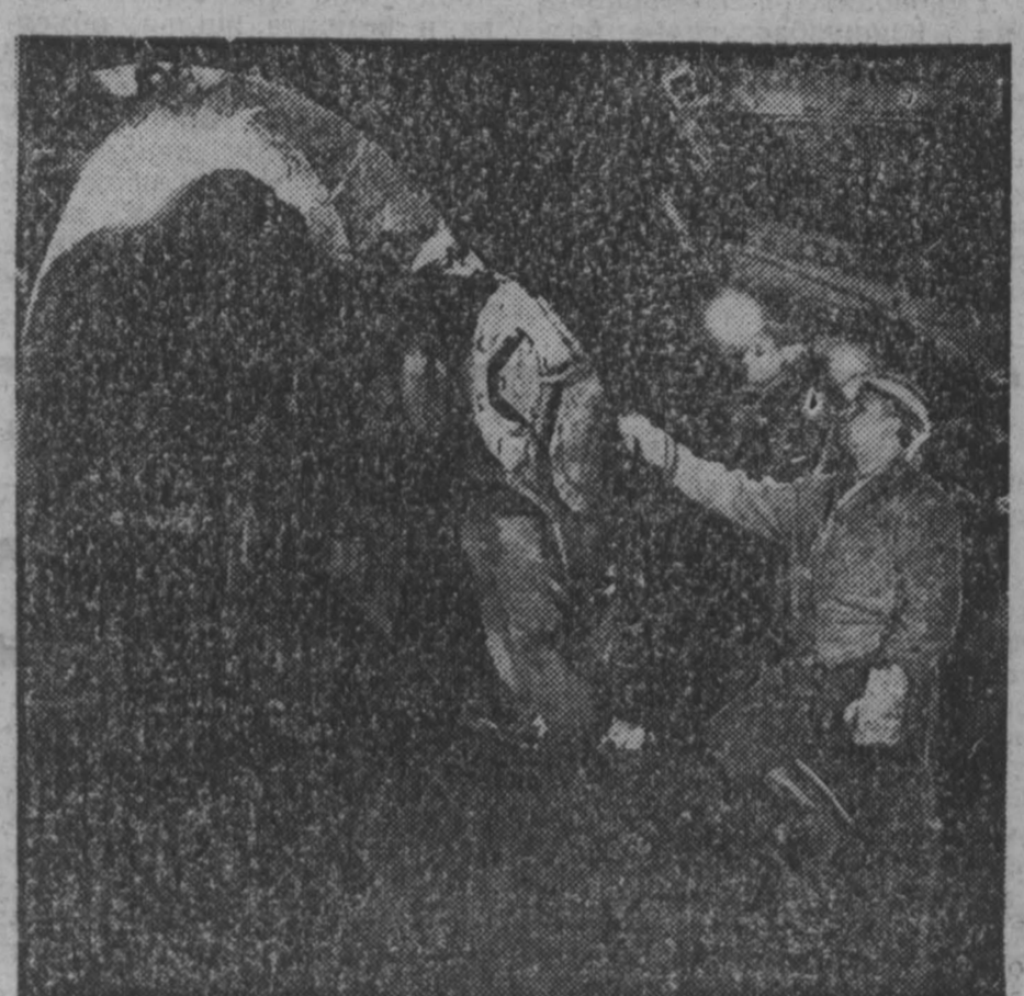
Фото А. Кузнецова, г. Междуреченск.

В этом году бригада П. Фролова намерена добыть 850 тысяч тонн конусующегося угля, что намного больше плановых заданий.