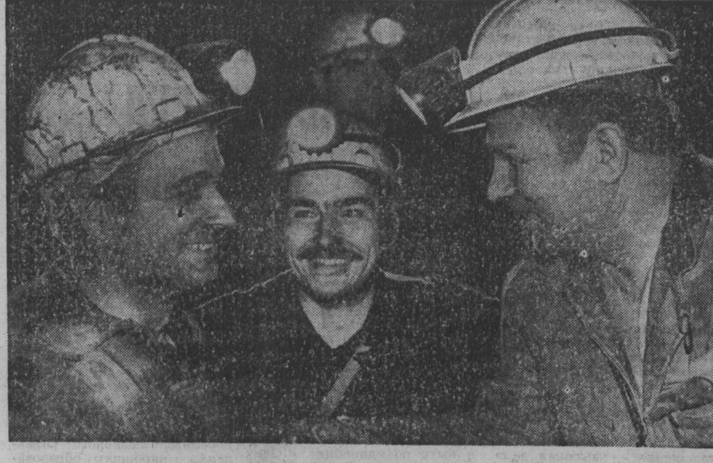
науча — производству