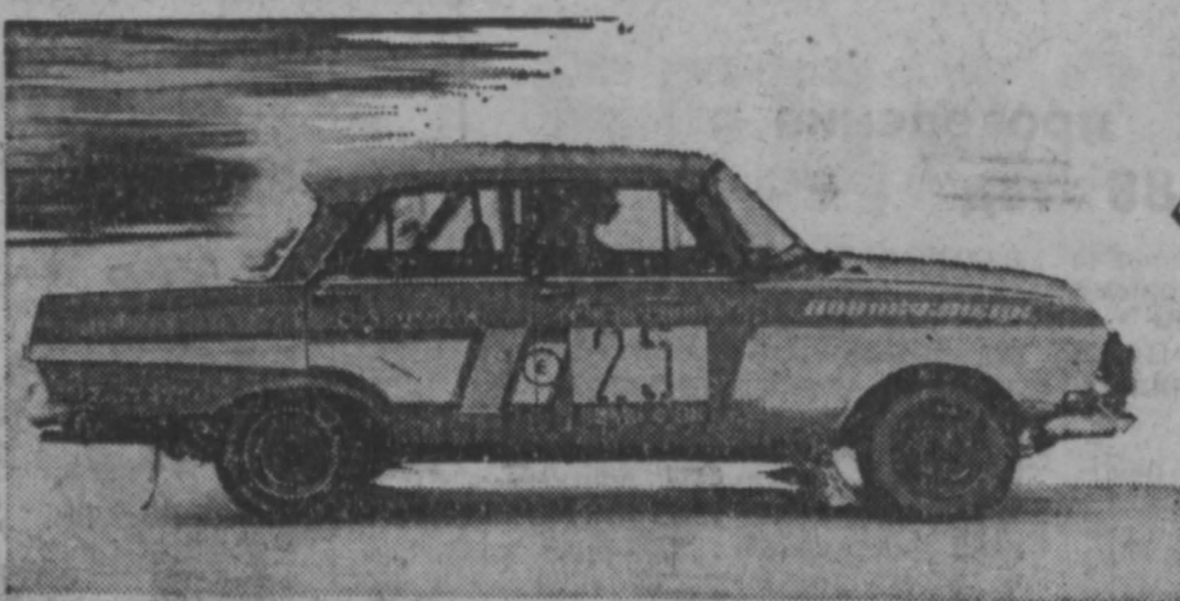
Необычно выглядела в минувшую субботу площадь ДК шахтеров, где стартовали автораллы «Сибирская зима-89».