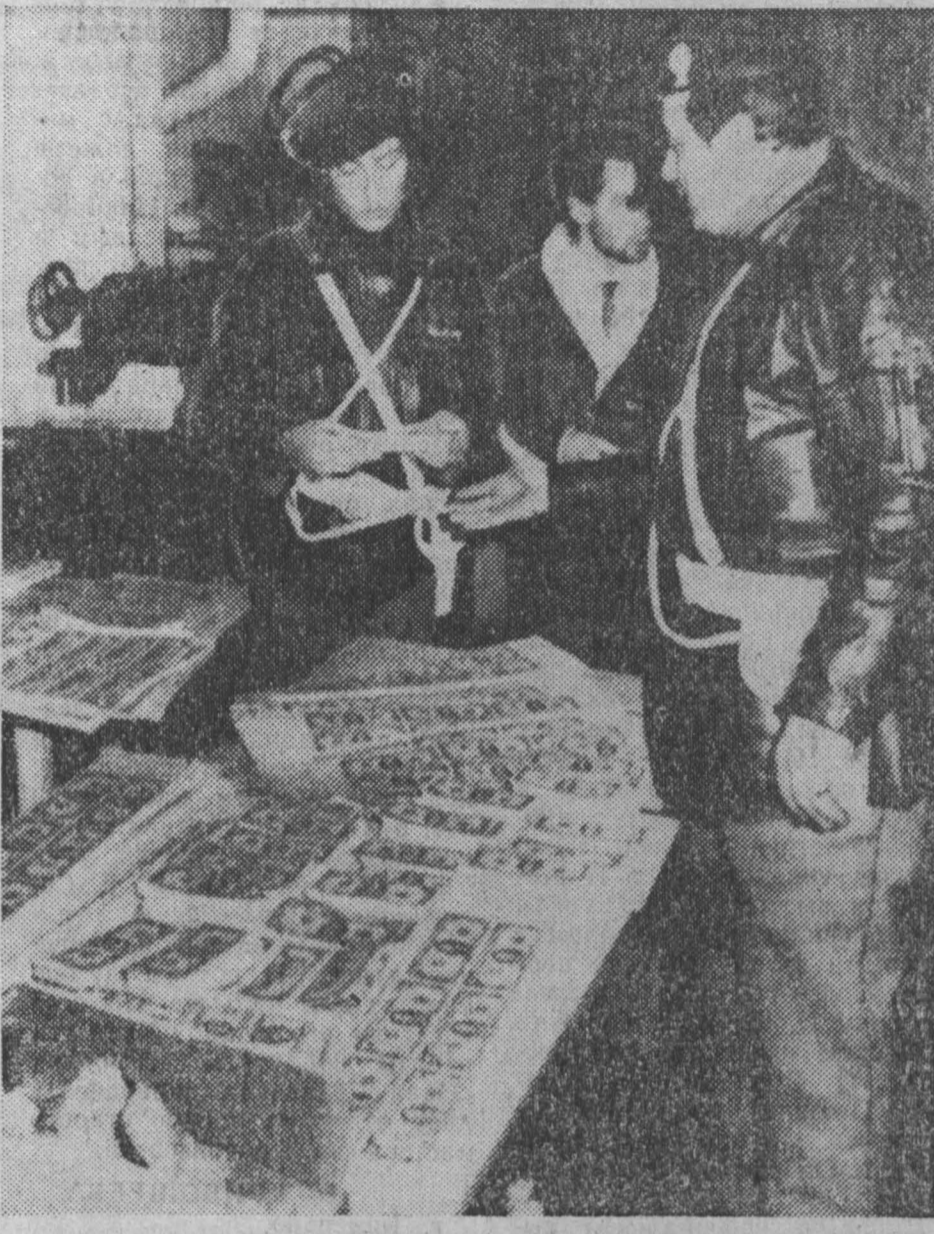
ИТАЛИЯ. Синдикат фальшивомонетчиков раскрыт в Италии, нанеся ущерб на сумму в 10 миллиардов долларов...