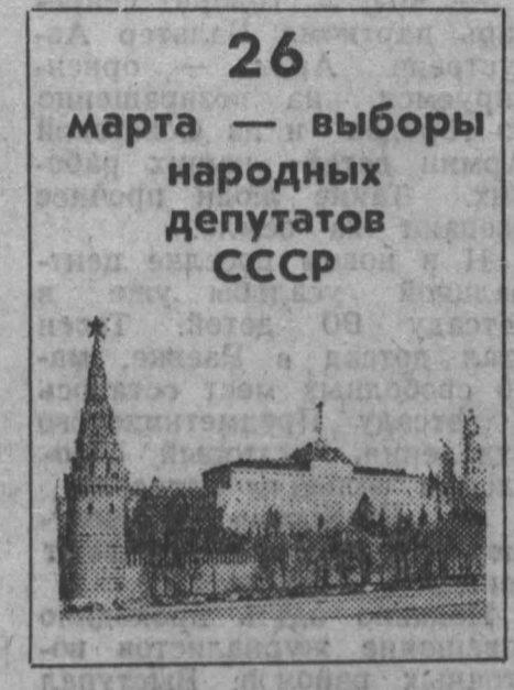
26 марта — выборы народных депутатов СССР

Репортаж с предвыборного окружного собрания избирателей Прокопьевского территориального избирательного округа № 194