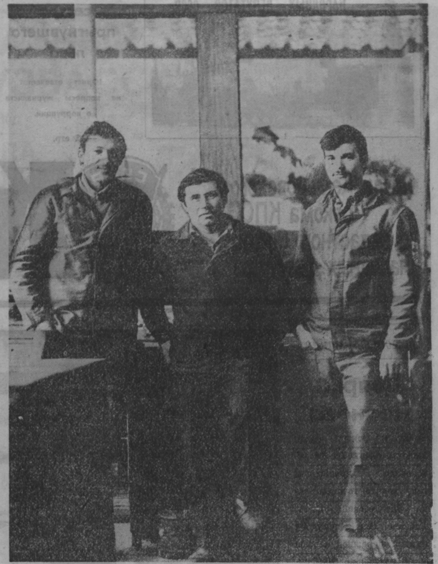
Нечасто приходит пополнение в коллектив электрощита Топкинского цементного завода — низка тут текучесть кадров, держится люди за свои места. Но жизнь есть жизнь, меняются рабочие и в электрощите.