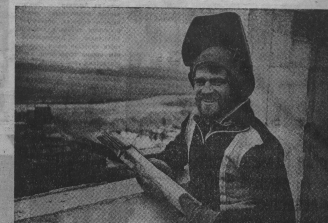
Строительный мост. Кузбасс—Армения

Очень несправедливо, болезненно это вопросы: как решить жилищную проблему, как добиться выполнения планов по строительству детских садов, школ, больниц, клубов, бань, как вообще сегодня строить в условиях острой нехватки рабочих рук и строительной техники? Победит ли разум? Если да, то поставленные задачи будут решены.