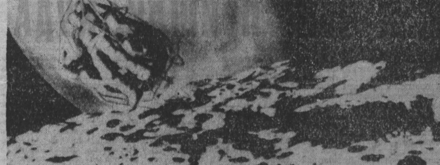
США. В начале следующего столетия национальное управление США по аэронавтике и исследованию космического пространства (НАСА) планирует осуществить полет космического корабля с экспедицией на борту с Земли на спутник Марса Фобос, организовать экспедицию на поверхность Марса, создать научную станцию на Луне, а также специальную базу на Луне, которую можно было бы использовать в качестве трамплина для обеспечения полета человека на Марс. Подвиги проекта содержится в разработанном НАСА новом плане долгосрочных исследований космического пространства в пределах Солнечной системы в XXI столетии. НА СНИМКЕ: на этом рисунке графически изображена высадка будущей экспедиции на спутник Марса Фобос.

ДЕЛИ. 2. (ТАСС). В глухой заросли заповедного леса в индийском штате Мегхала лесорубы натолкнулись на удивительное, заросшее светлой шерстью существо, напоминающее одновременно и оленя, и человека. Рост его около 3 метров, эта «человек-обезьяна» обитает в горах Тамил на высоте примерно в 1000 метров. Ее видели несколько раз, когда она отгоняла здоровенной палкой слона и разрывала на части пальмовые листья, выеда из них сочную сердцевину. Рядом проливался раскаты лесорубов, один из местных политиков отпраздновал в эти глухие места лесного заповедника Сонгани, изобилующего самой редкой животностью, и сам видел странные следы длинной в 60 сантиметров, оставленные на песке, в разрыве маршаслона, то ли убитого немто, то ли погнутого по какой-либо другой причине.