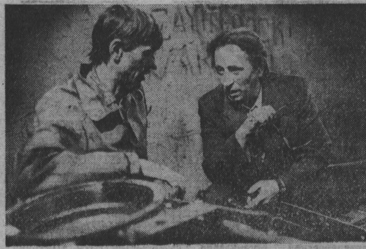
И для села, и для города