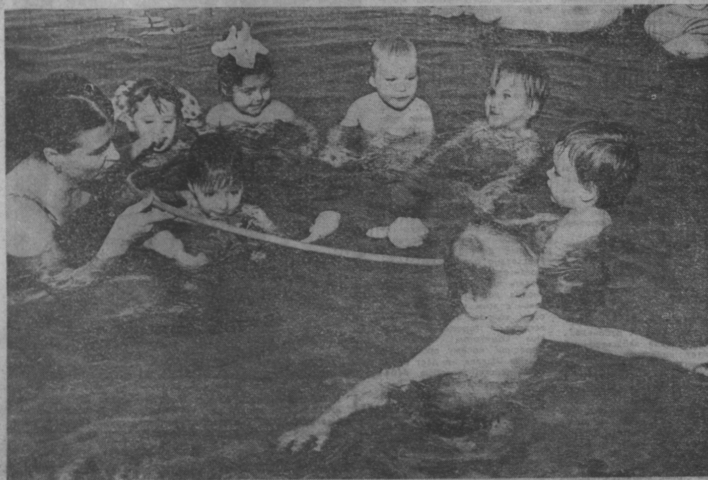
Мои ребятами без конца болел ОРЗ. Научите меня, пожалуйста, как надо заботиться о детях.