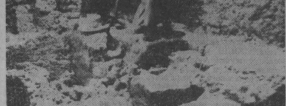
Согласно сообщениям, поступившим из Перу, здесь обнаружено древнее захоронение, относящееся к культуре Мочика — древней цивилизации индейцев, живших на северном побережье страны.

НА СНИМКАХ: Сипан — местонахождение древнего захоронения Мочика; индус раскопки.