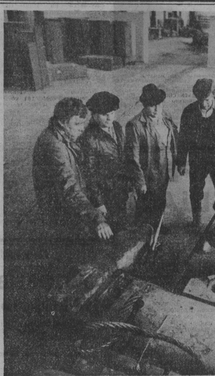
НА РАЗРЕЗЕ «Ольжаресский» сдан под монтаж технологического оборудования производственных цехов. В СНИМКЕ: новый цех принимает оборудование — установка очередного станка.

В статье «Талоны на кефир» («Кузбасс» от 1 сентября) говорилось о недостаточном снабжении кисло-молочными продуктами и сырами населения г. Топки. Завод молочной продукции, расфасованной в стеклянные бутылки, в том числе и кефир, производится в Кемеровском молокобинном комбинате по спецификации к заключенному договору на поставку молочной продукции. Вопрос об увеличении поставок кисло-молочных продуктов торговыми организациями г. Топки не ставился перед объединением и Кемеровским молокобинным комбинатом. Реализация сыров «кавказский», «карачевский», «грозный» ведется согласно выделенным управлением торговли Кемеровского облисполкома фондам. Топкинский молокозавод в настоящее время не может из-за отсутствия мощностей выпускать кисло-молочную продукцию, однако полностью обеспечивает население города Топки другим диетическим молочным продуктом — творогом обезжиренным. В дальнейшем планируется построить новый завод с целью по производству молока и кисло-молочных продуктов в расфасованном виде. В 1987 году институту «Кемеровоагропроект» выдано задание на проектирование нового завода. Для проведения строительных и ремонтных работ, замены оборудования, технологиче-