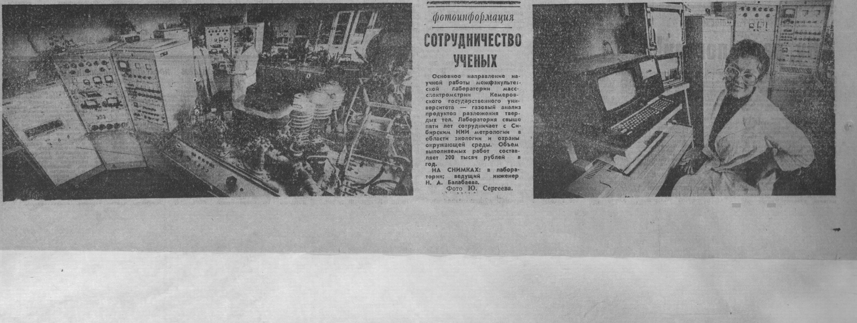
фотоинформация СОТРУДНИЧЕСТВО УЧЕНЫХ