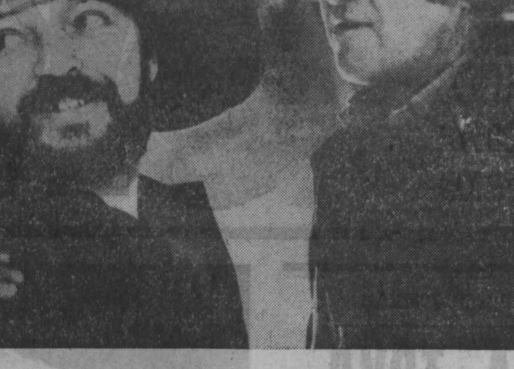
за строкой протокола