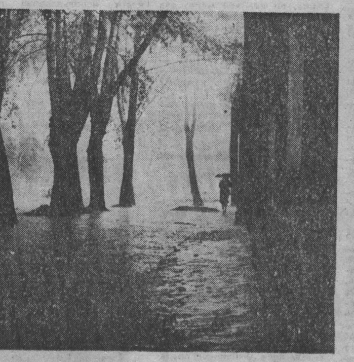
Дождливый день.