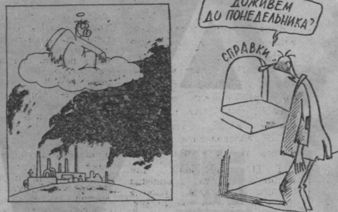
Рис. М. Ларичева.