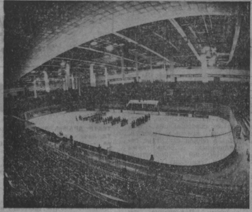
В спор за путевку на финальный соревнование IX зимней Спартакиады народов РСФСР, которые пройдут в марте, вступили сибиряки. По пяти видам спорта зональные соревнования хозяйками стали кузбассовцы.

То, что ныне существующая система воспитания и обучения детей — сирот и детей, оставшихся без попечения родителей, нуждается в коренном изменении, очевидно, пожалуй, всем. Поиски, эксперименты в этом деле будут вестись и у нас в области. Как уже сообщалось, в Кузбассе планируется строительство детского дома семейного типа. Другой путь — эксперимент, который начинал Кемеровский горно в наступившем году — опекунская семья.