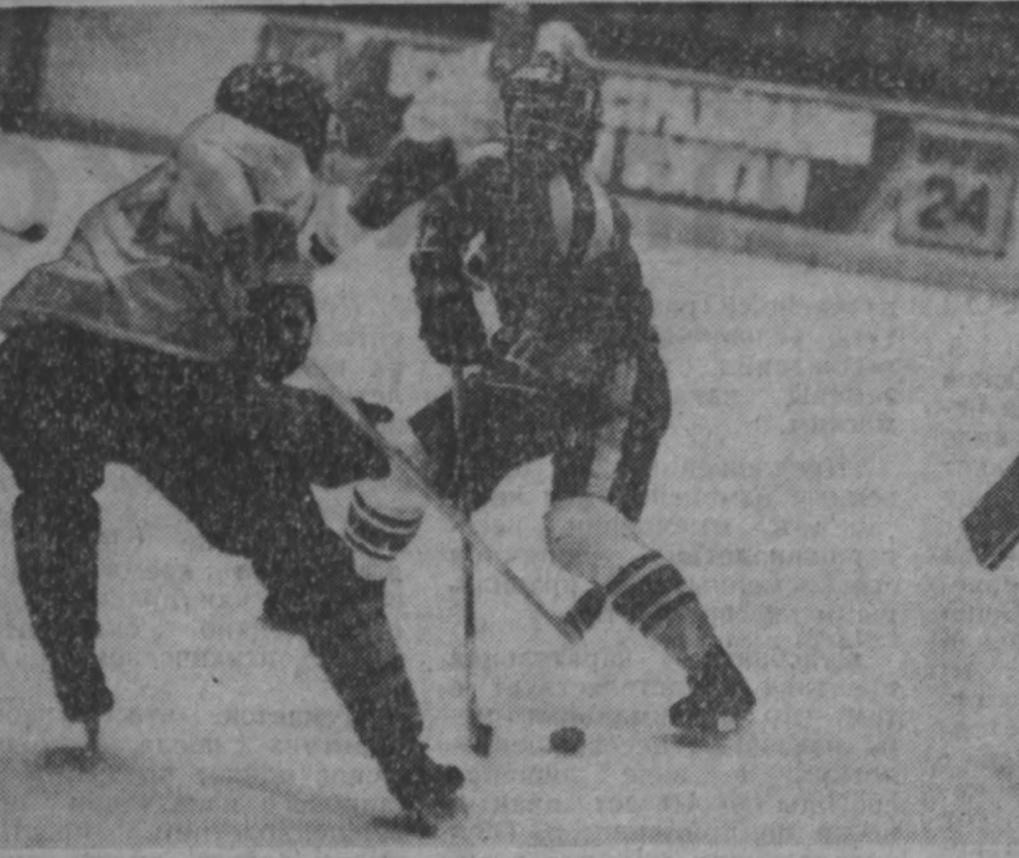
Зональная Спартакиада набирает темп, показывая свои силы и слабые стороны. Радости побед и горечи поражений, без которых немалым спортом — все это сегодня составляет рабочие будни «спортивно-оздоровительной» молодежи. Если хоккейная дружина Кузбасса, занимая третью строчку в судейских протоколах, не потеряла еще надежды на путевку в финал, то горнолыжники и двоборцы уже обеспечили себе путевку полными составами.