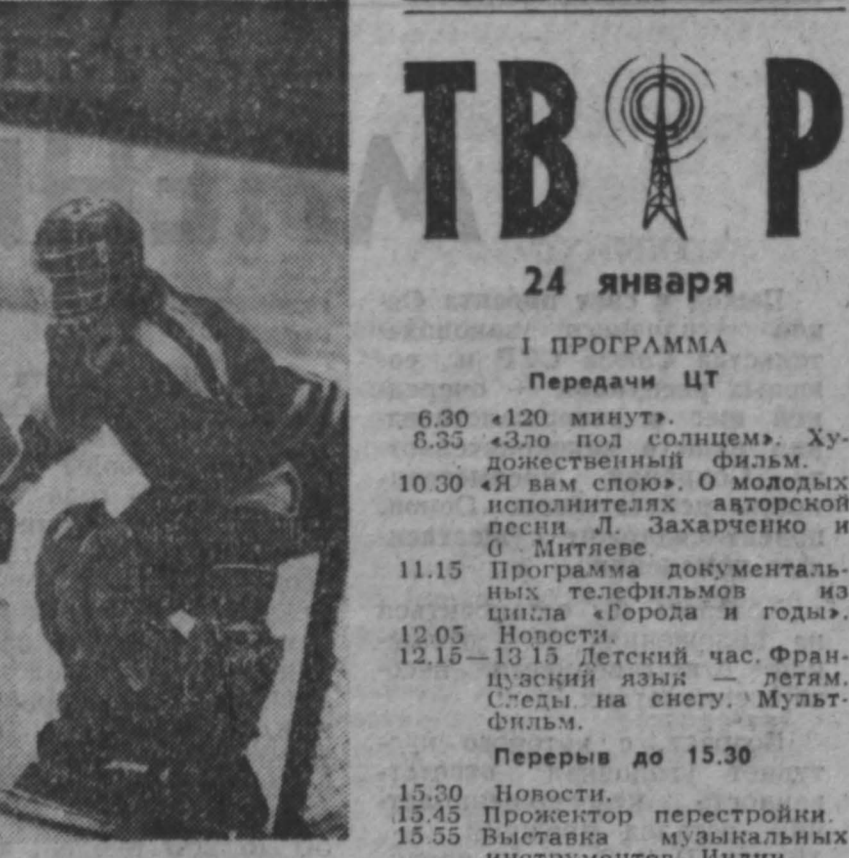
Зональная Спартакиада набирает темп, показывая свои силы и слабые стороны. Радости побед и горечи поражений, без которых немалым спортом — все это сегодня составляет рабочие будни «спортивно-оздоровительной» молодежи. Если хоккейная дружина Кузбасса, занимая третью строчку в судейских протоколах, не потеряла еще надежды на путевку в финал, то горнолыжники и двоборцы уже обеспечили себе путевку полными составами.