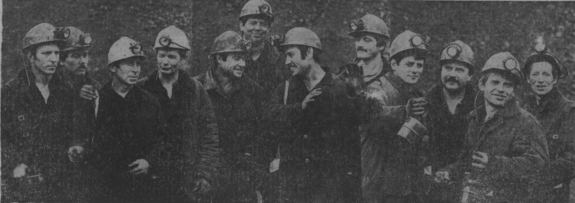
В трудовом коллективе шахты «Бутоская» на первый план снова вышли обычные заботы о судьбе производства, о решении социальных вопросов. Прошедшая забастовка, в которой участвовали и горняки этой шахты, не могла не повлиять на настроения людей.

этому предложению. Не может нас не беспокоить и партийное пополнение. Снизилось и приход в целом, и прием рабочих. За прошедшие семь месяцев на стол положили партийные билеты более тысячи человек, значительно больше, чем в прошлом году. Ситуация не столь драматична, среди уходящих немало попутчиков, остаются самые проверенные товарищи. Эти факты никак не должны мешать нам искать партию от тех, кто недостойно себя ведет, компрометирует ее.