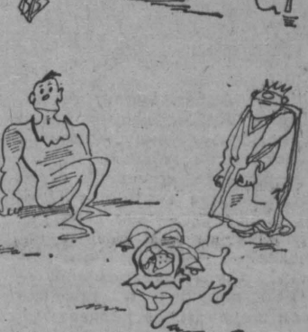
Рис. В. Васильева.

До чего ж живуч институт монархий! Буря антифеодалных, антимонархических революций, расклевывавшая и старонесшиеся по планете, селила десятилетиями абсолютных монархов. Но и в наш ядерный, космический век примерно три десятка государств мира возглавляют монархи. Среди них 12 королей, 4 королевны, 1 император, 3 герцога, князя, 2 султана, 3 эмира, 1 шейх, 1 князь, папа римский.