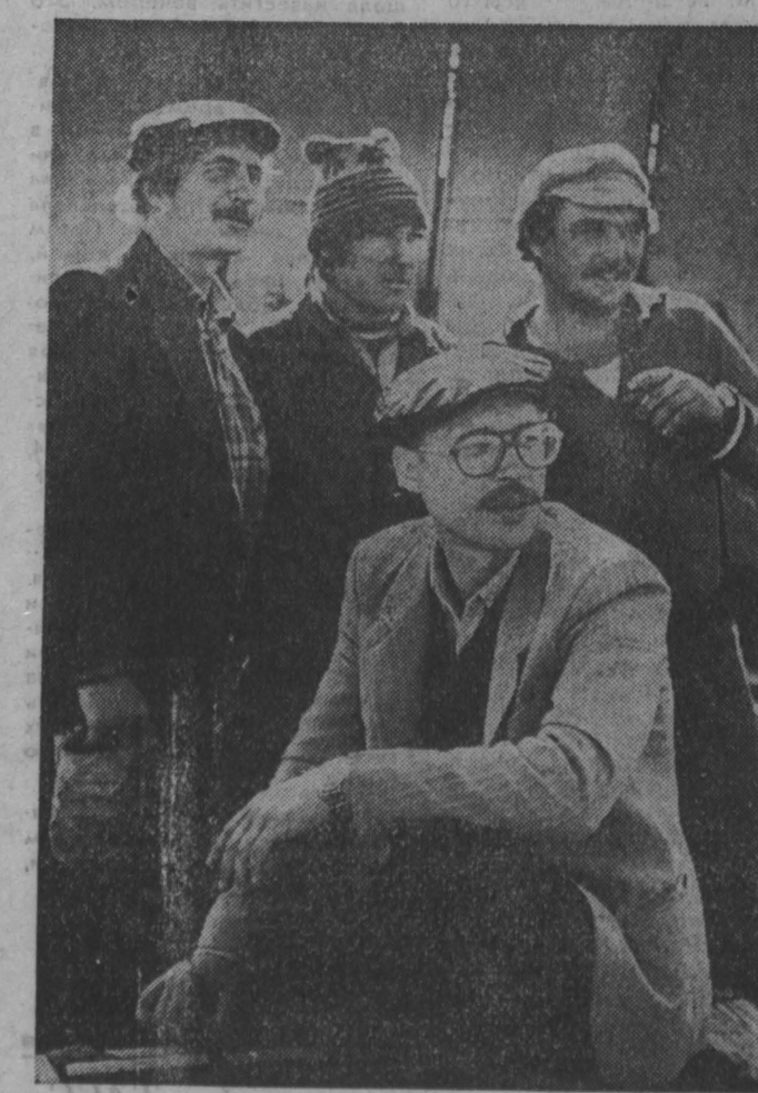
В ПОЛЕТЕ «СОЮЗ ТМ-8»