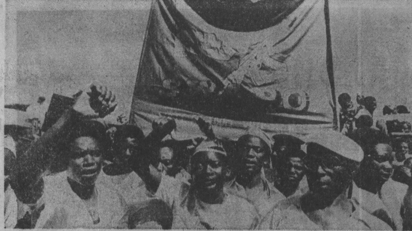
После более чем 70 лет господства ЮАР в Намибии продолжается процесс деколонизации последней колонии Африки...