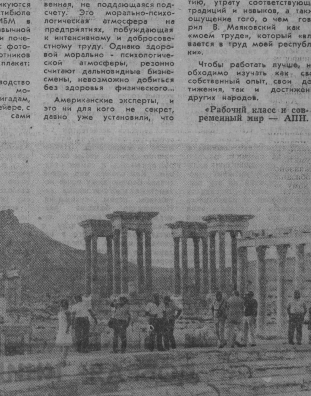
Достопримечательности Сирии Древние памятники Сирии подобны открытой книге, из которой узнаешь историю человечества. Здесь оставили свой след великие цивилизации. Здесь ассимилировались многие культуры. НА СНИМКЕ: Пальмира — одна из известных достопримечательностей страны. Покоренная и разрушенная много веков назад римскими легионерами, она продолжает поражать своей красотой и величием другие легионы — легионы туристов.