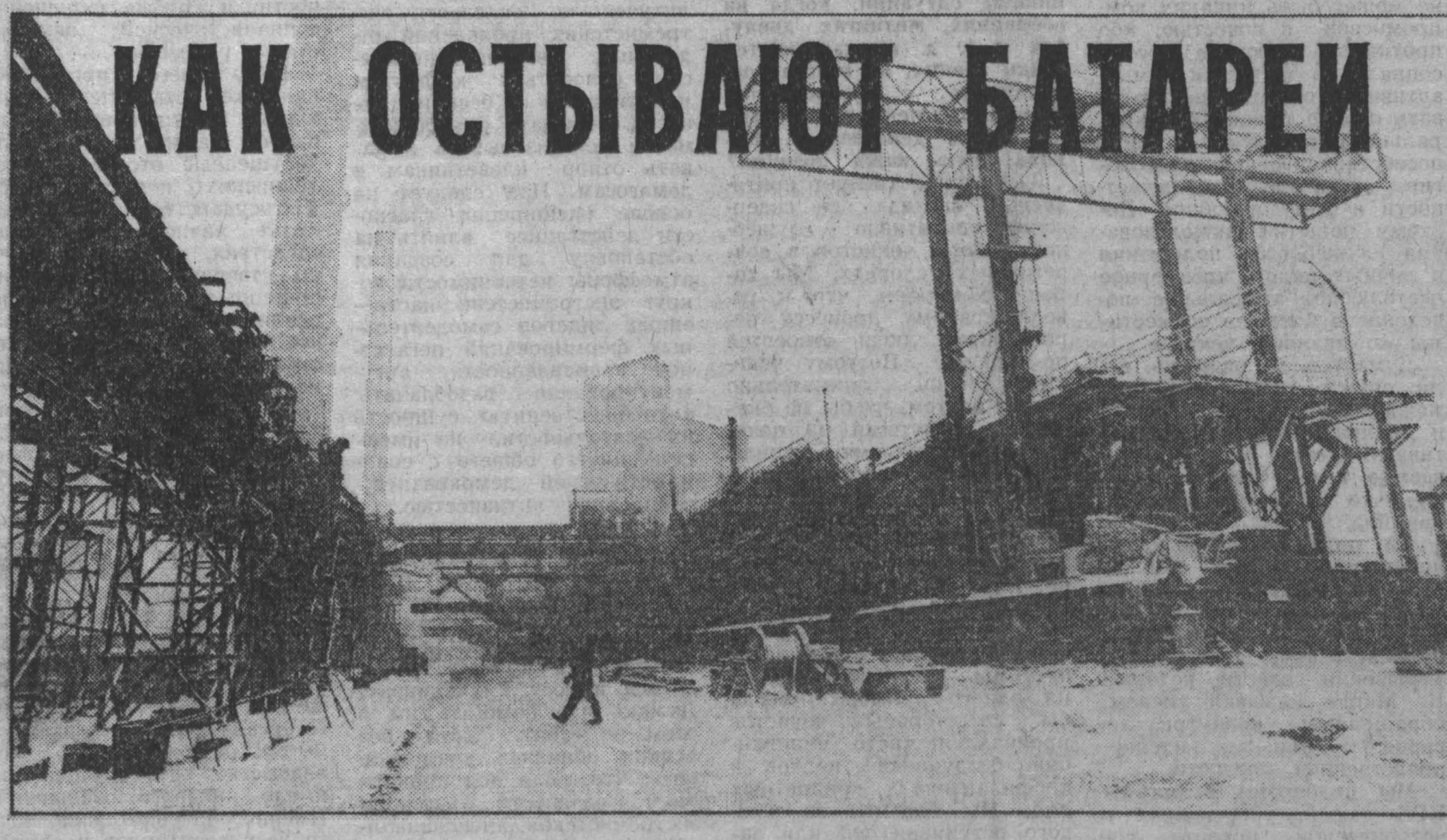
КАК ОСТЫВАЮТ БАТАРЕИ