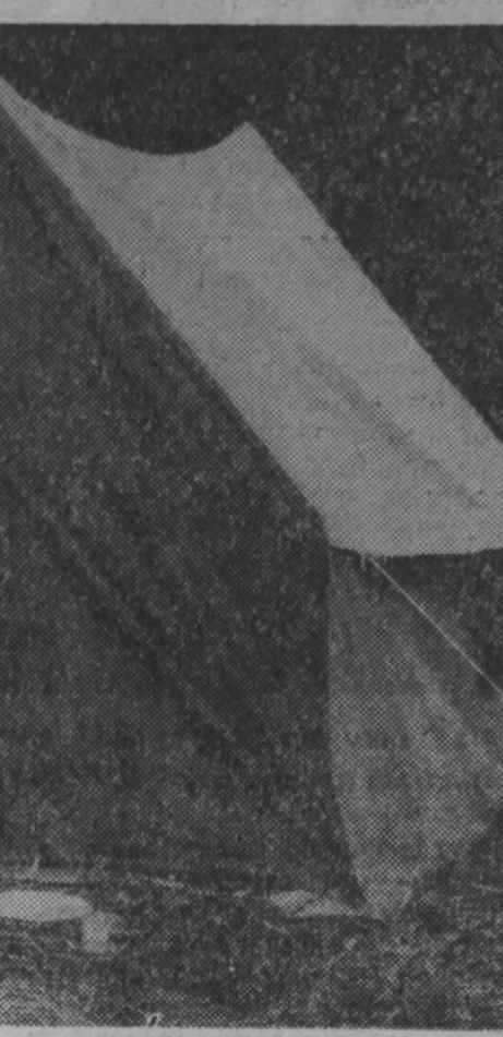
фотоинформация Лето в пионерском лагере В разгаре лето. Весело живется ребятам в пионерском лагере «Мечта». Мальчишки и девчонки здесь много занимаются спортом, сами организуют интересные игры и даже вызывают порой на соревнования своих наставников — вожаков и педагогов. Но не только отдыхают в эти летние дни пионеры «Мечты». Успешно проходят в пионерлагере трудовые десанты, когда сами школьники работают на присущем им участке. НА СНИМКАХ: в пионерском лагере «Мечта».