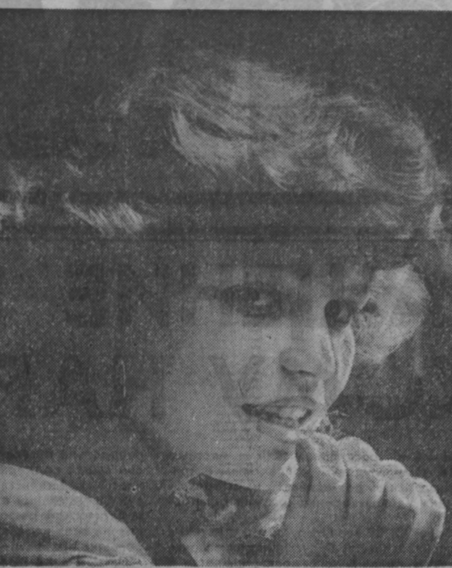
Сотни юных прокопчан отдыхают в эти летние дни в пионерских лагерях, расположенных в живописных окрестностях города. — Зенковский парк, на Чумыше. НА СНИМКАХ: пионервожатая лагеря «Космос» Ма-