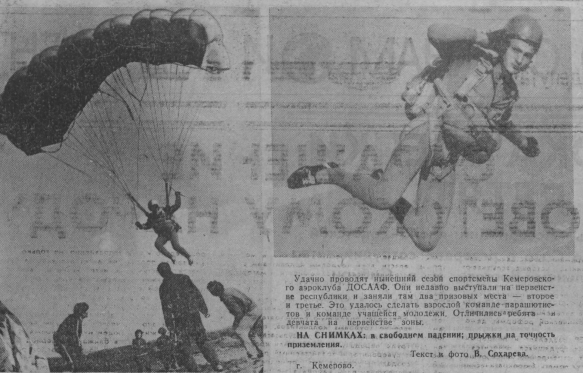
Удачно провалят нынешний сезон спортсмены Кемеровского аэроклуба ДОСААФ. Они не только выступили на перенесенных республике и заняли там два призовых места — второе и третье. Это удалось сделать взрослой команде парашютистов и команде учащейся молодежи. Отличился ребята и летчики на первенстве зоны.

В период забастовки ни от стачечных комитетов, ни от забастовщиков не поступило ни одной жалобы на милицию. Практика охраны порядка подтвердила еще раз огромный потенциал рабочего класса. Мы признательны стачечным и рабочим дружинам за проявленную ими решительность и дисциплинированность. Работники милиции в свою очередь примут все зависящее от них для активизации борьбы с уголовной преступностью и обеспечения спокойствия и здоровья граждан.