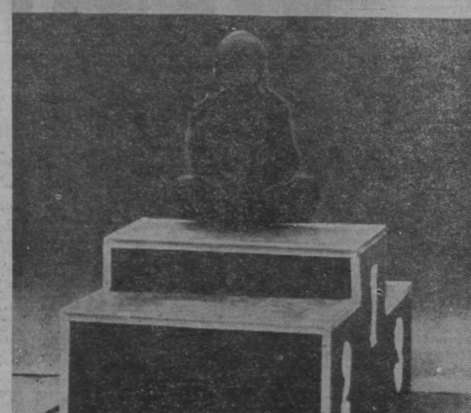
Мечта о большом помосте [буду чемпионом]. г. Кемерово.