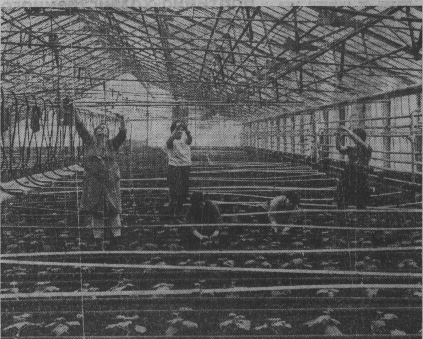
В конце прошлого года в совхозе «Суховский» вступил в строй третий блок теплиц площадью в три гектара...