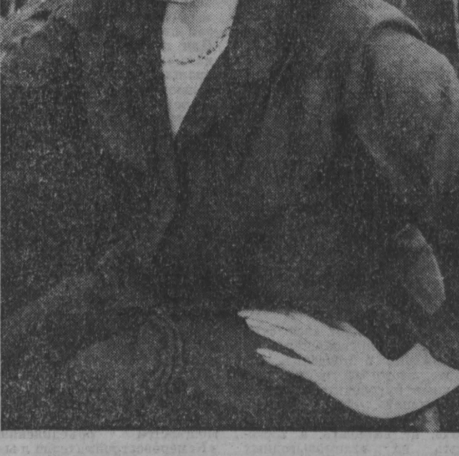
Любого агронома спросить, что является самым доступным и дешевым фактором роста урожайности...