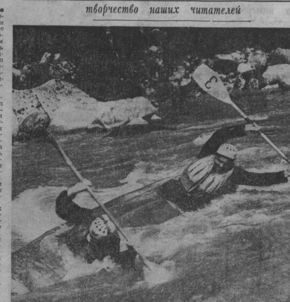
ОПАСНАЯ СИТУАЦИЯ.

х продолжалась борьба со стихией, идет очистка территории от радиоактивных и химических веществ. Он мне говорил: «Для молодежи было бы лучше, им еще жить да жить, иметь детей. Нужно, чтобы подключились к работам, кто может из старшего поколения. Этим молодым спавсем». Словом, снова подается Макара работать в опасные места.