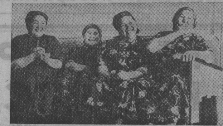
На этом снимке — участники фольклорного ансамбля из села Беково. Наша газета рассказывает об этом коллективе, бережно сохраняющем народные музыкальные традиции.