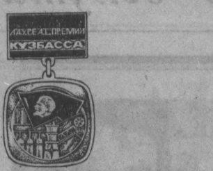
Лауреаты премии Кузбасса