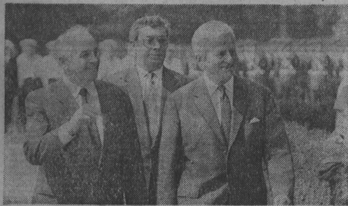
Завершился визит М. С. Горбачева в ФРГ.