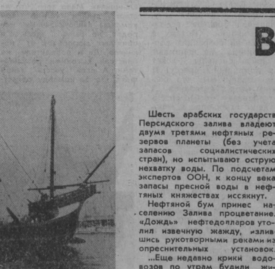
В объективе Барселона. На снимках: одна из достопримечательностей Барселоны — копия корабля Колумба «Санта Марья»; кафедральный собор.