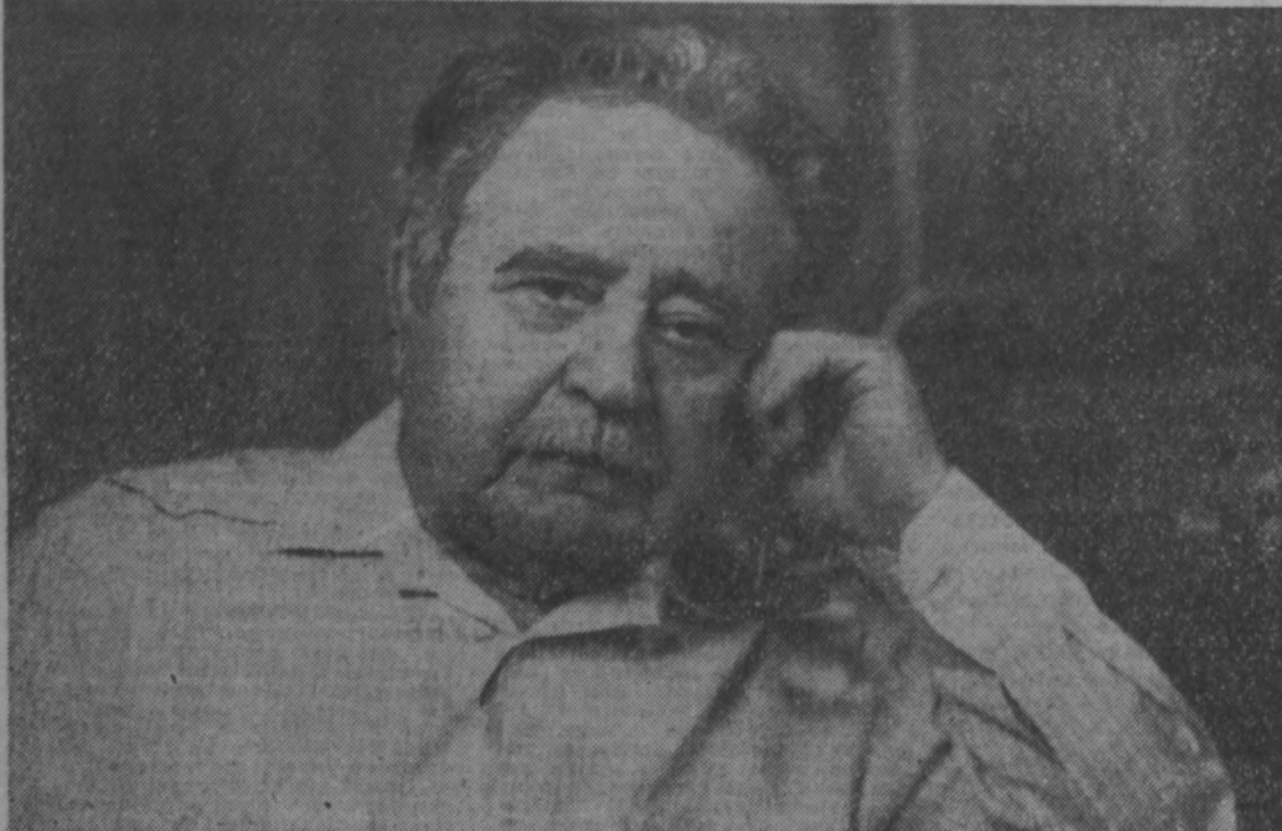
люди земли Кузнецкой