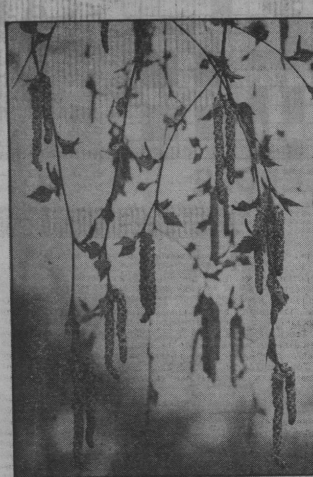
ВЕСНА ИДЕТ Фото Г. Пичугина, Ленинск-Кузнецкий район.

— Негусто, — сказал я Виктору. — Ничего, была бы земля, а вернуть ей ее исконных обитателей нам по силам. Честно говоря, я не очень-то поверил тогда Трембычу. Подумалось: помереть и сло-