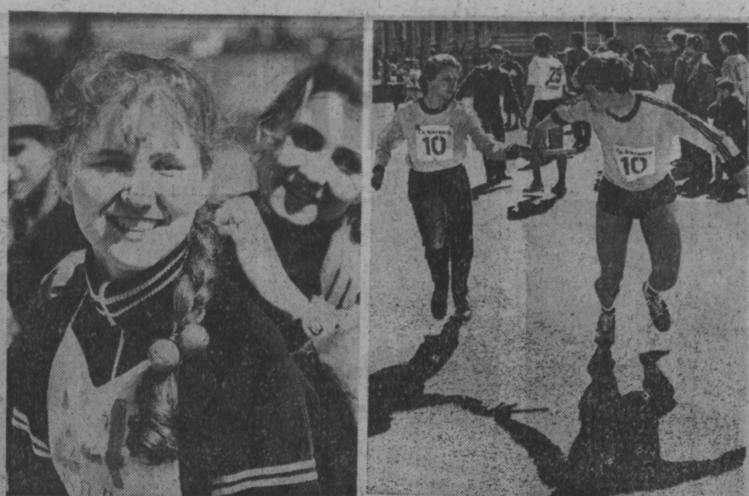
на приз газеты «Кузбасс»