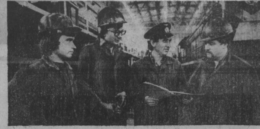
В ПРЕИМУЩЕСТВАХ хозрасчета убедилась на практике в цехе по ремонту тепловозов локомотивного депо Новокузнецка.