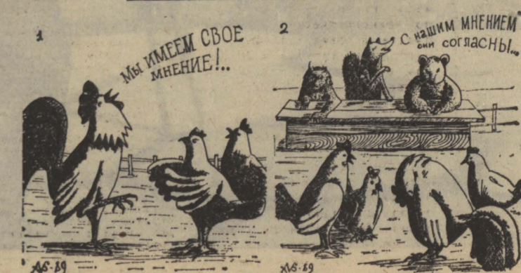
Рис. Н. Астраханцева.