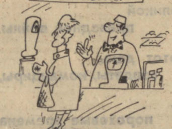
Рис. С. Веткина.

Никто не ценит так добро и не стоит так дешево, как ВЕЖЛИВОСТЬ!