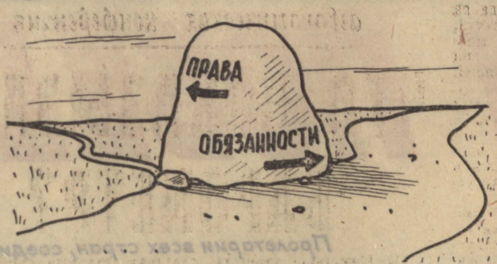
Рис. М. Ларичева.

Как должно огородничество развиваться дальше? Думаю, по пути расширения земельного участка. Ведь на деле получается так, что сад есть, а огород разместить негде. Возьмем конкретно Кузбасский политехнический институт, где я работаю. У нас два садоводческих кооператива — один в деревне Писаная, в 60 километрах от города, другой в 30 километрах в деревне Илиндевка. А землю под картошку нам выделяют в 60 километрах от города в совхозе «Уньгинский», совсем в против-