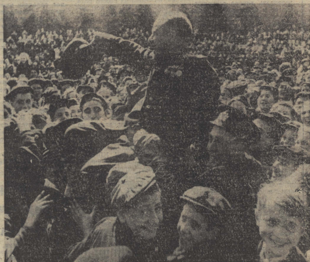
Снимок М. Трахмана, сделанный 9 мая 1945 года на Красной площади в Москве. Фотохроника ТАСС

НГУЕН БИНЬ ЗАНГ , секретарь провинциального комитета партии; ДО ГУАНГ ГУНГ , председатель народного комитета провинции Куангбинь.