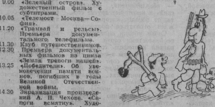
Рис. В. Милейко.

9 мая 7.38 Погода. 8.25 Программа областных газет. 8.36 Песни Победы. 14.15 Концерт по запискам радиослушателей. 15.00 «Священный Дню Победы. Стеннописание (по программе «Малы»: 20.00 Звездный концерт «С днем рождения, Победа».