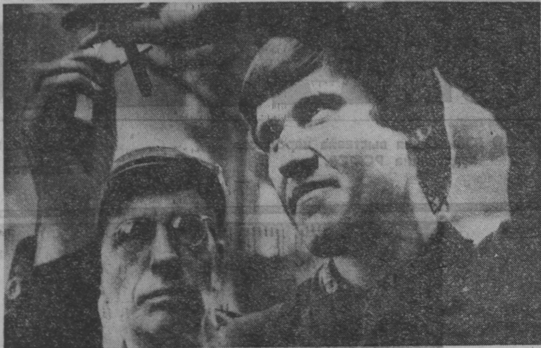
Основное профессиональное качество слесаря-инструментальщика — точность в исполнении любой работы. В инструментальном цехе 14-го Государственного подшипникового завода изготавливают оснастку, рвущий инструмент для выпускающих цехов.

нам, то есть за сутки до роздаты. Неужели до этого последнего момента в обидногорте не могут распределить издания по городам и сообщать об этом населению хотя бы за неделю? Есть последние возможности — приобрести книгу в обмен на макулатуру. Но, оказывается, магазин «Сти-мул» закрыт, так как себя не оправдывает. Действительно, те книги, которые маж и уходят, поступали из Кемерово, никаким стимулом быть не могут. Обидногорте предлагает нам лишь остатки того, что реализуется в больших городах. Это подтвердили маж и в пункт те приемы втосырья.