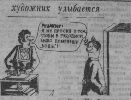
художник улыбается. Рис. И. Азимова.

«НЕМЕРОВЧИ» ТЕХНИКУМ МЕХАНИЗАЦИИ УЧЕТА ПРИНЦИПАТ ЗАВЕРИ от предприятия, организации, учреждений на 1989 год на правлении, молодых специалистах ПО СПЕЦИАЛЬНОСТИ: 1720 — бухгалтерия; учет; 1734 — техника; механические программы; подотчетная осуществляется на договорных началах. Заявки принимаются до 25 мая.