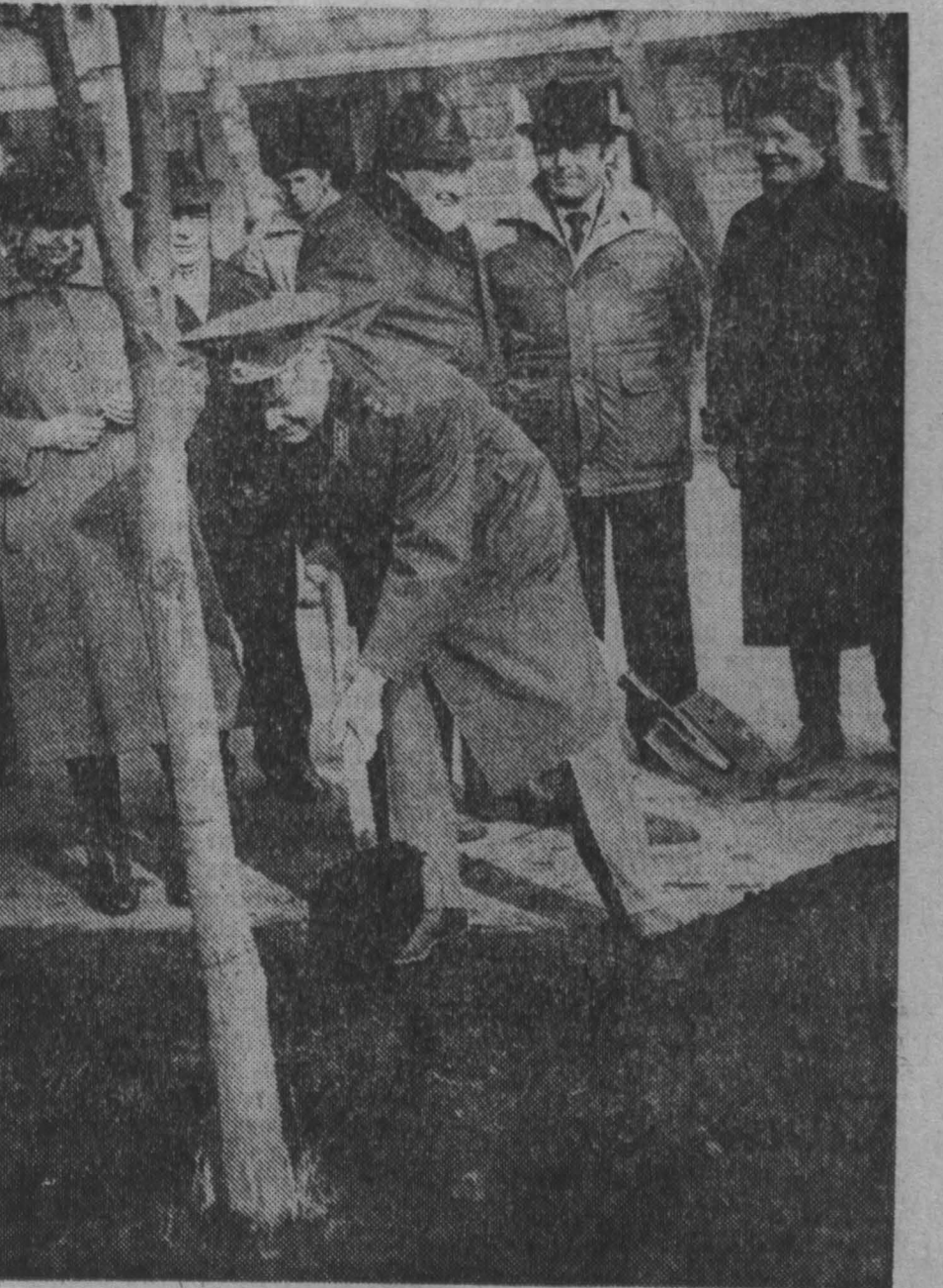
фотография на память

9 апреля 1988 года. Герои Советского Союза, летчик-космонавт СССР Г. С. Титов сажает дерево на аллею Героев в Кемерово.