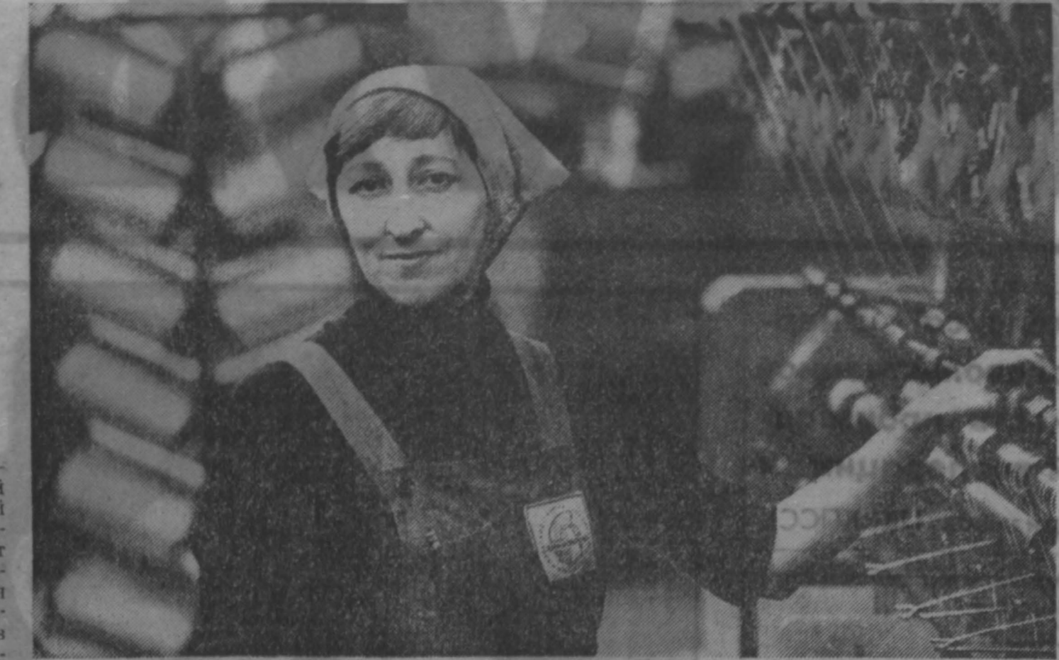
Давно и с самой лучшей стороны известна во втором крупном цехе производства кормов немарковского производственного объединения «Химволоно»...