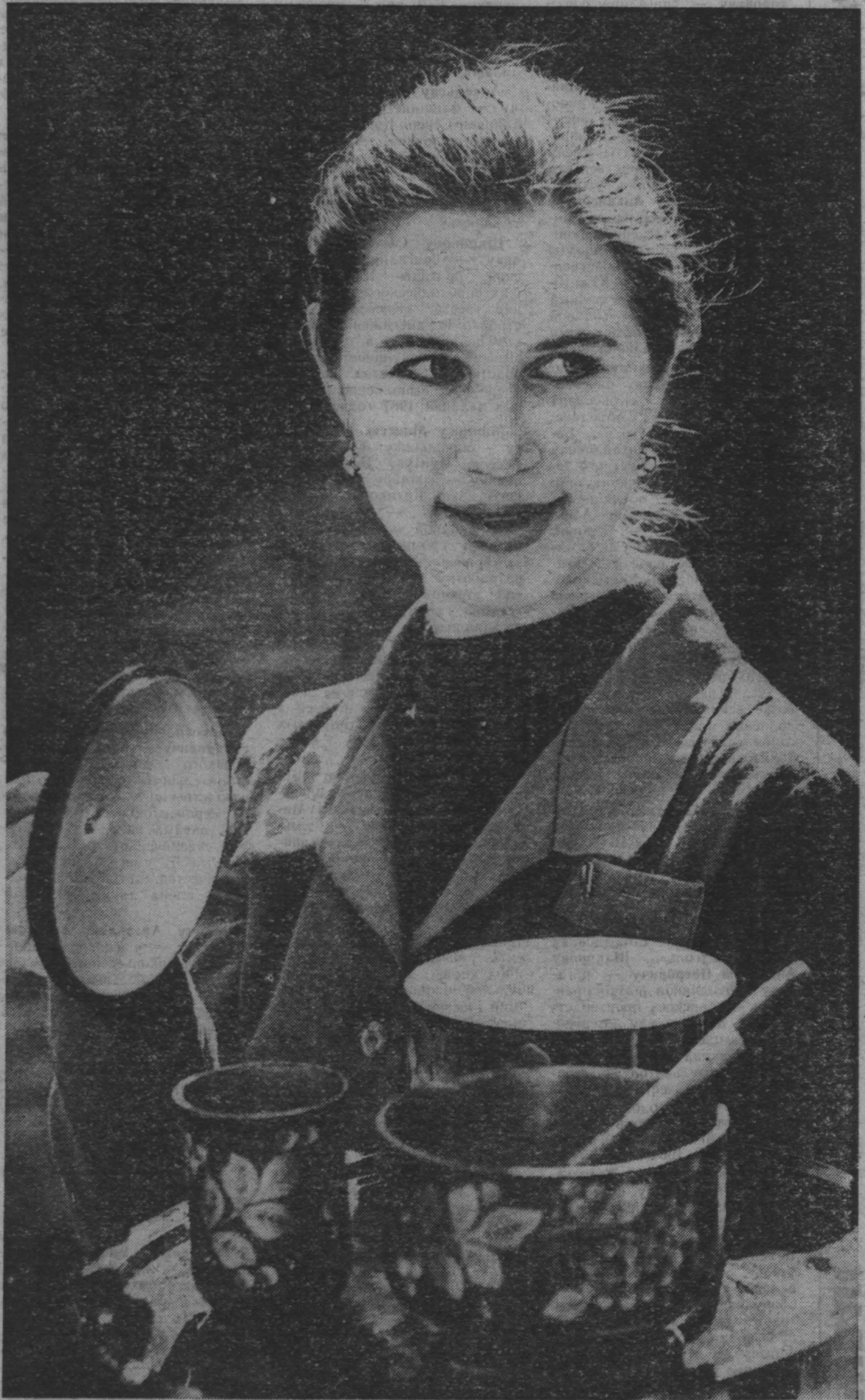
г. Кемерово. (Окончание на 5-й стр.)

Совет Министров РСФСР и Всесоюзный Центральный Совет Профессиональных Союзов, рассмотрев итоги Всероссийского социалистического соревнования за успешное выполнение Государственного плана экономического и социального развития РСФСР на 1987 год, постановили признать победителями и наградить переходящими Красными знаменами Совета Министров РСФСР и ВЦСПС за достижение высоких результатов во Всероссийском социалистическом соревновании, ус-