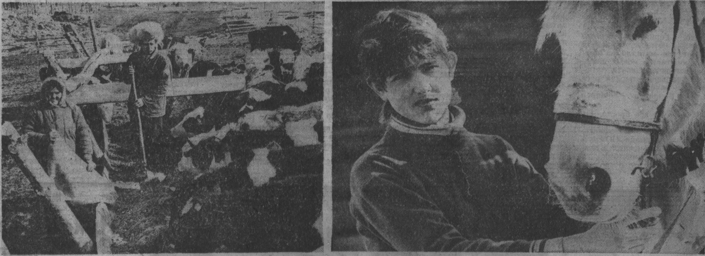
Семейный подряд: взгляд на проблему

Е. НОСЫРЕВ, корр. «Кузбасса», г. Ленинск-Кузнецкий.