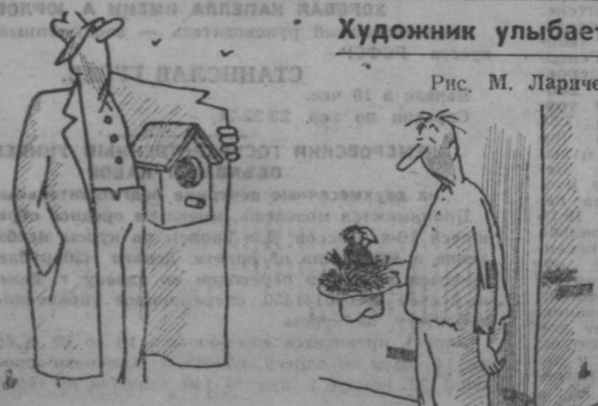
Рис. М. Ларичева.