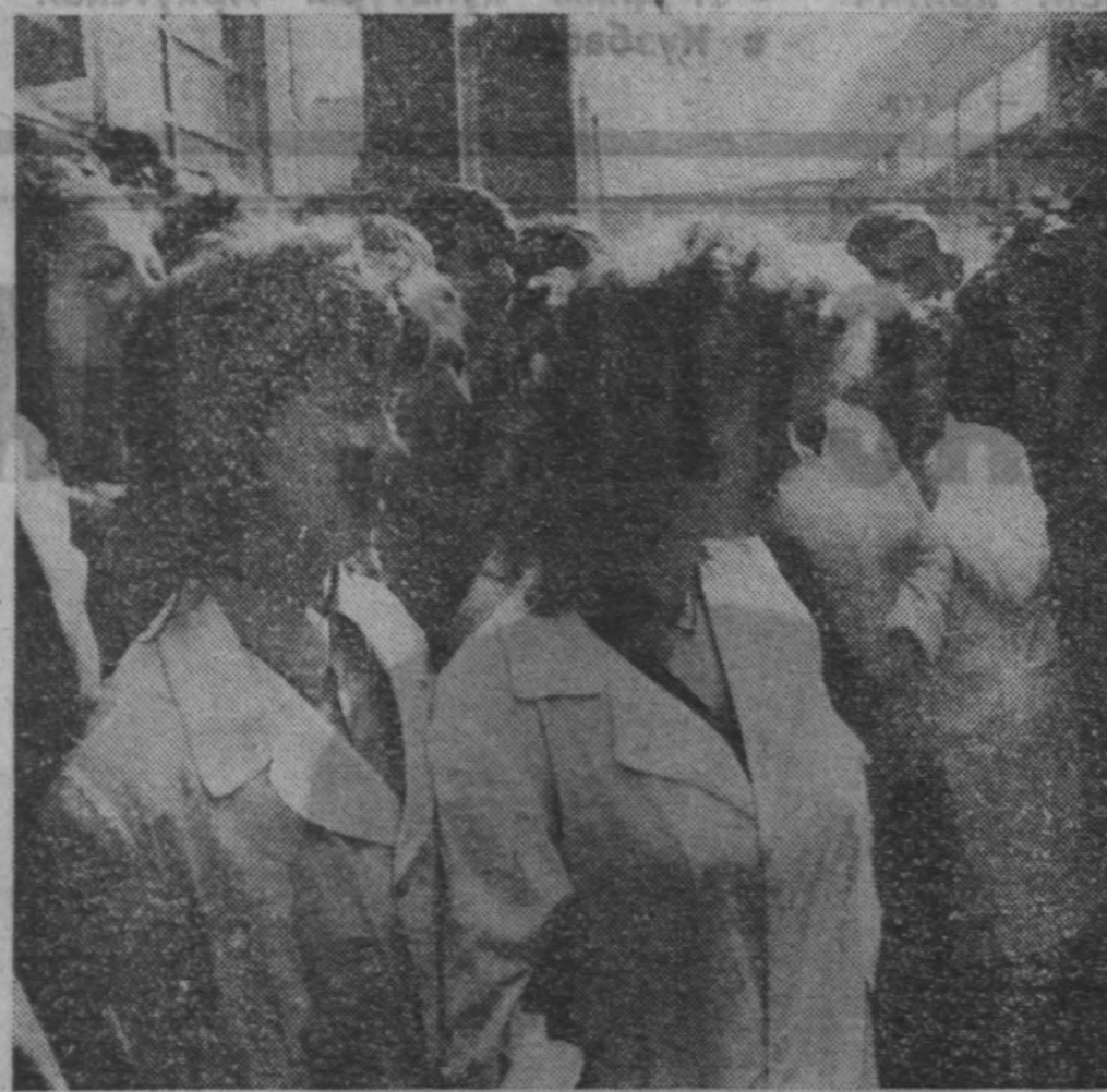
Во время беседы с рабочими завода «Алгоритм».

У вас большое будущее, говорит Генеральный секретарь, обращаясь к ним. Впервые, потому что вы молодые, средний возраст работников предприятия, как мне сообщили, 28 лет. Во-вторых, вы трудитесь на переднем крае промышленности, каким является сегодня вычислительная техника. Это, конечно же, интересная работа. Особенно для молодых. Хорошо, что на завод пришли работать, как я заметил, узбекские девушки. А ведь совсем недавно подобным тру-