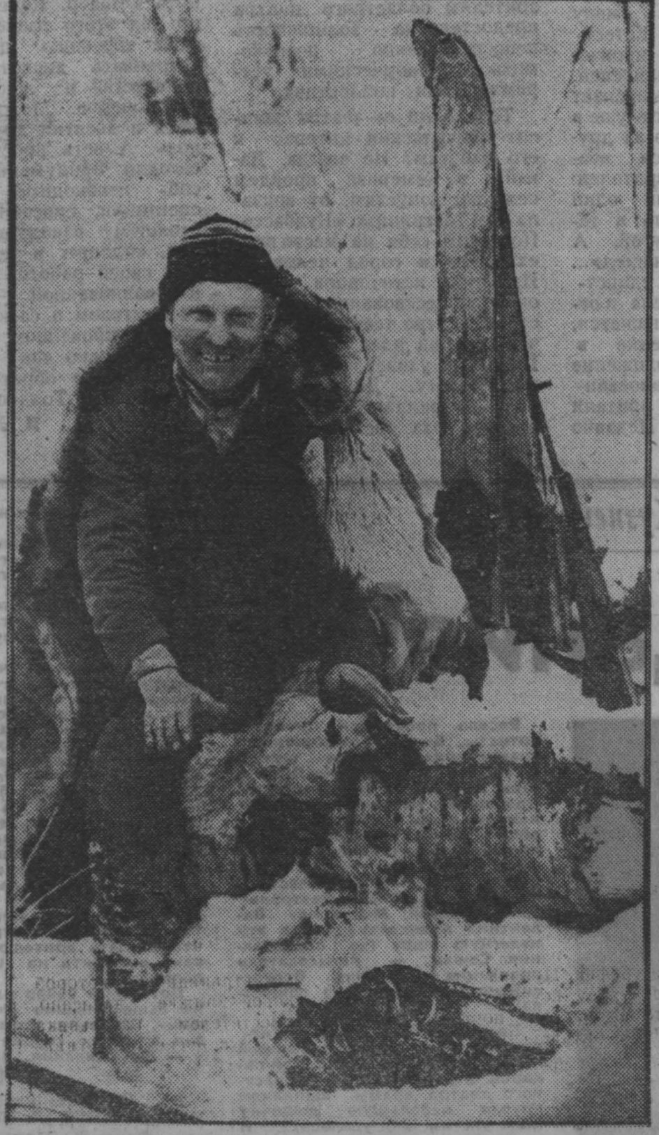
Фото Ю. Сергеева. Тисульский район.

РЫБАЛКА начинается на остановке 118-го автобуса.