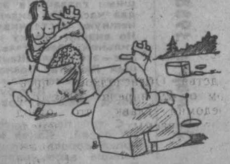
Без слов... Рис. М. Ларичева.