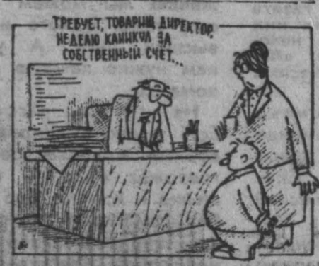
Художник улыбается. Рис. Ю. Иванова.