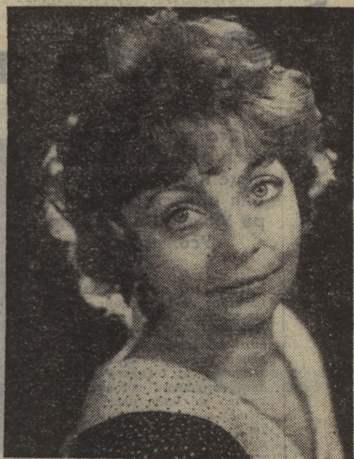
лауреаты второго Всесоюзного фестиваля

От огня твоей жизни немеркнувшей, Родина.