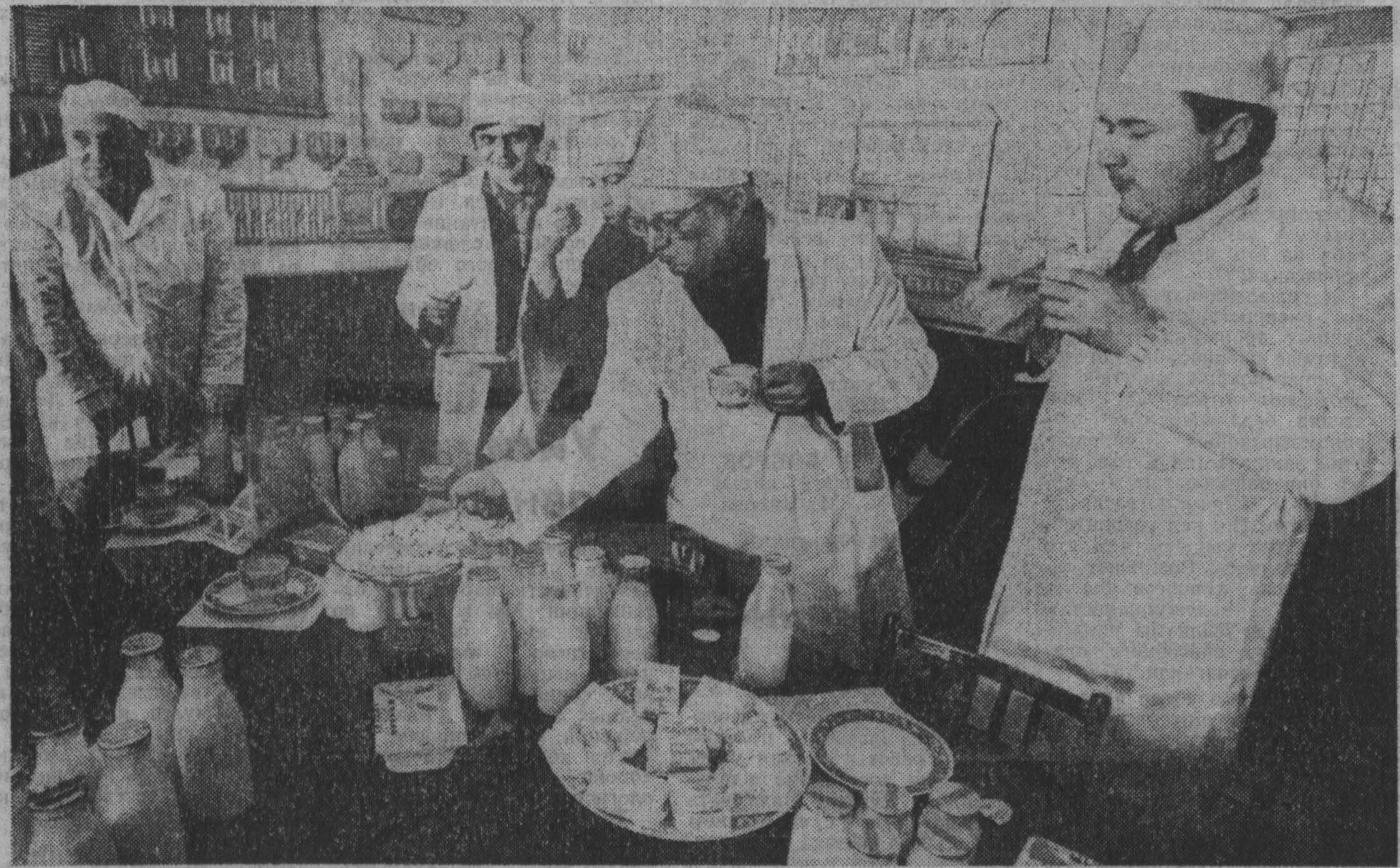
опыт наших соседей

го, как в целом чувствует себя завод в условиях действия Закона о госпредприятии?