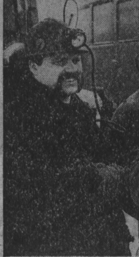
Учеба и труд всё перетрут