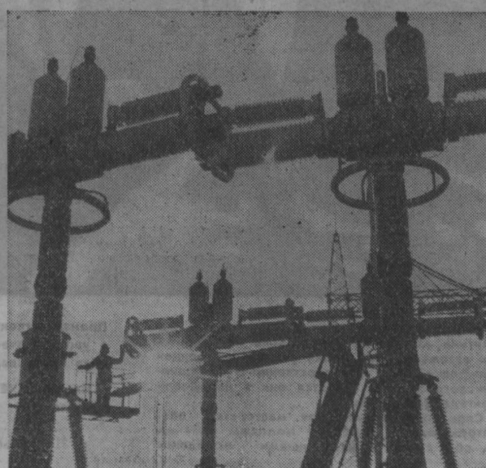
КРАСНОЯРСКИЙ КРАЙ. Звездой первой величины на энергетической карте СССР станет Березовская ГРЭС-1, возводимая в районе Канско-Ачинского топливно-энергетического комплекса. В конце нынешнего года первый агрегат станции мощностью 500 тысяч киловатт выдал ток. Агрегат оборудован информационно-вычислительным центром, которому предстоит не только регистрировать данные, но и управлять работой самого блока.