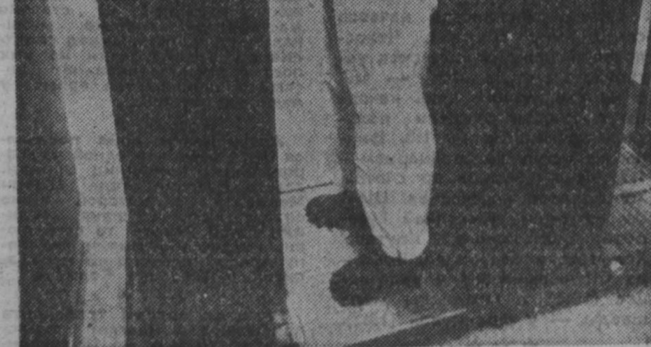
ТАСС, 16 февраля.

Политический обозреватель деловой «Патриот», анализируя политику Пакистана относительно урегулирования обстановки вокруг Афганистана, пишет: «В индийской столице растут опасения, что пакистанская сторона с молчаливого согласия Пентагона, устанавливает палки в колеса выработке в Женеве соглашения по Афганистану и продолжает переговоры с США о поставках Исламабаду все новых и новых видов вооружений».