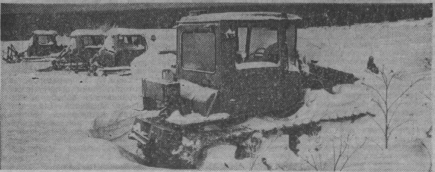
Н. КУЗНЕЦОВ, спец. корр. «Кузбасса». Кемеровский район.