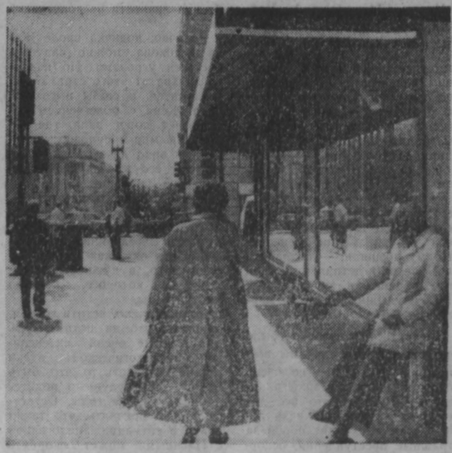
По данным специальной рабочей группы врачей, изучающей проблему голода в Америке, в самой богатой стране капиталистического мира голодает или просто голодает около 30 млн. человек, в том числе 12 млн. детей. Не случайно, что в США насчитывается, по разным данным, от трех до пяти миллионов бездомных и можно видеть целые семьи с детьми, зачучающие на свалках ах парков и в дворах. НА СНИМКЕ: этот покинутый житель Вашингтона просит милостыню у своих соотечественников.