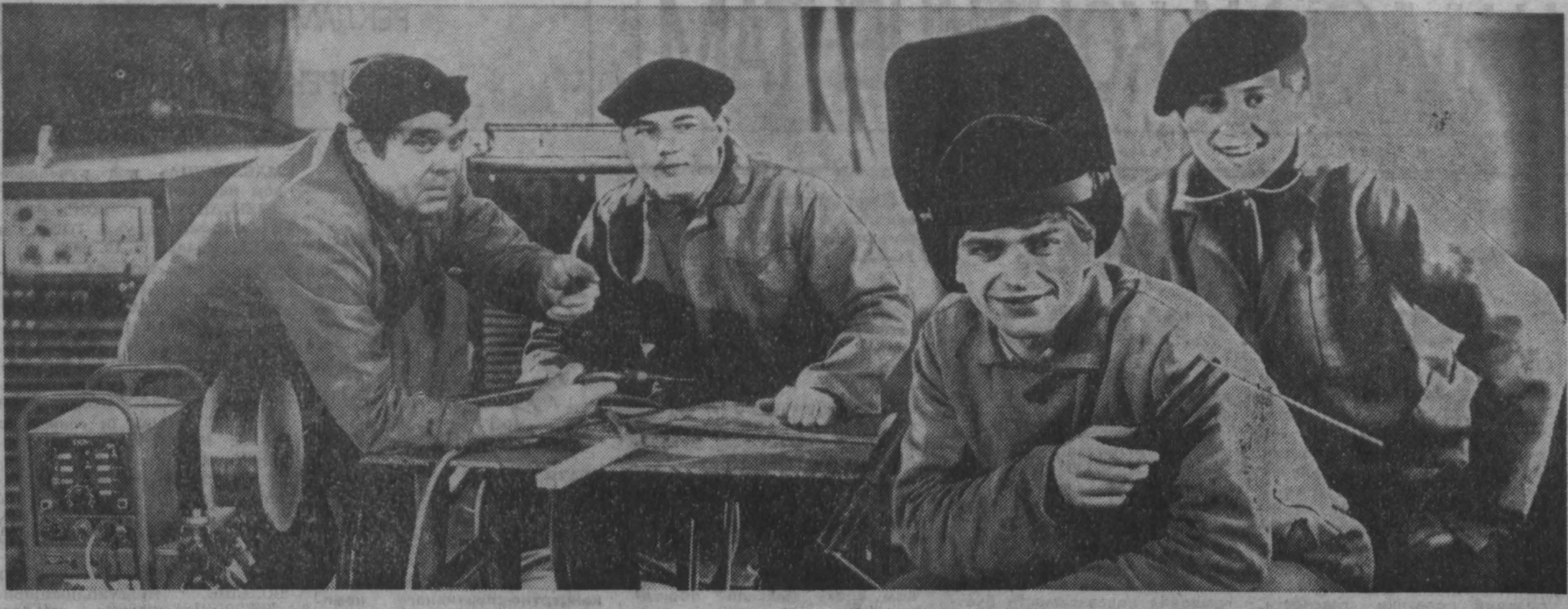
лауреаты второго Всесоюзного фестиваля

Адрес издательства «Кузбасс»: 650630, ГСП, г. Кемерово, проспект Октябрьский, 28.