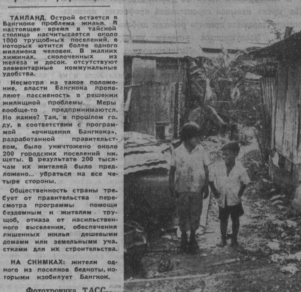
ТАИЛАНД. Острой остается в Бангкоке проблема жилья. В настоящее время в тайской столице насчитывается около 1000 трущобных поселений...