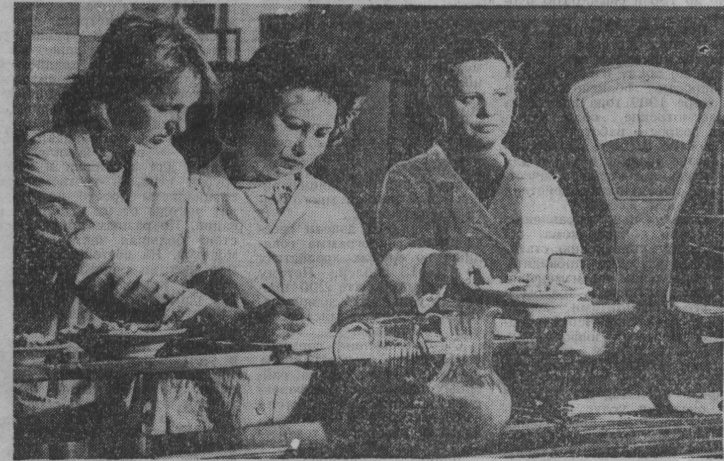
Во время ежедневных проверок своих заводских столовых группы рабочего контроля объединения «Карболит» старается в меру возмужавшей помочь работникам общественного питания в решении разного рода проблем. Они добились изменения графика завоза молока, возвращают некачественные продукты поставщику. Для того, чтобы лучше

Сборник выпущен Политбюро ЦК компартий союзных республик, крайкомов и обкомов партии по актуальным вопросам аграрной политики КПСС на современном этапе. Встречи и беседы М. С. Горбачева на Орловской земле 14-15 ноября 1988 года.